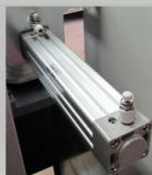
Equipamento pneumático de 1a. linha