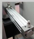
Equipamento pneumático de 1a. linha