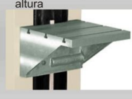
Mesa com regulagem altura